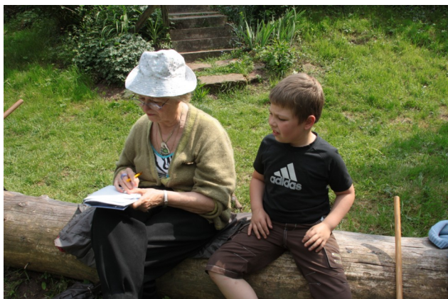
Poète et apprenti-poète dans le jardin