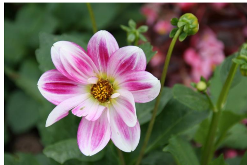
Fleur de Giverny