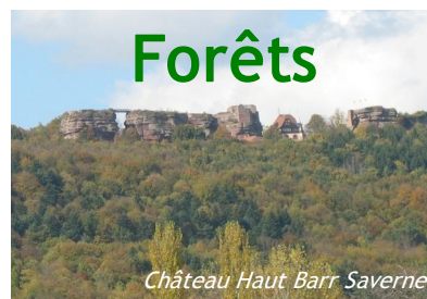
Château Haut Barr Saverne

Le soleil émerveille la nature. Nos pas bruissent dans le calme. Les vieilles pierres rencontrent nos cœurs.